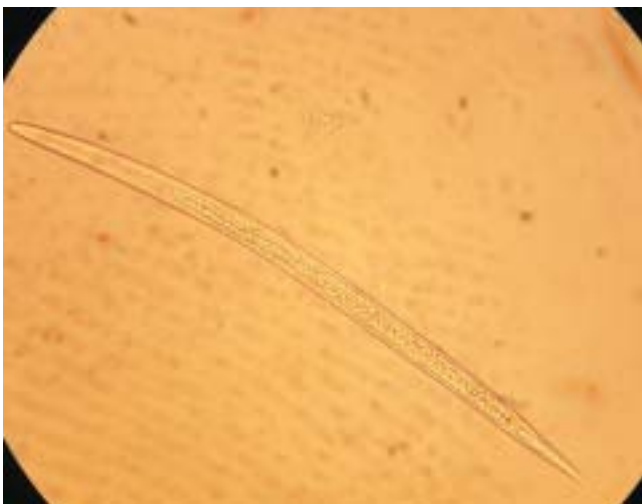
1. Ub-ubbing a root-knot a nematode , 0.3 mm a kaatiddog, naipakadakkel ti pannakaiparangna iti 300 a daras iti pudno a kadakkela

Kadagiti naglabas a 50 a tawtawen, ti pannakatimbeng dagiti root-knot a nematode iti agrikultura ket isu ti gagangay a panagusar kadagiti pestisido. Dagiti nematisido ken pagsuob ti daga ( soil fumigants ) masansan a maiyaplikar iti daga sakbay a maimula ti maapit a mula. Ngem ti limitado a kaadda dagitoy kadagiti napanglaw a pagpagilian ti posibilidad a pannakarugit ti aglawlaw, pannakadangran ti salun-at, ken nangina ti bayadda kapilitan a sukatanda dagitoy