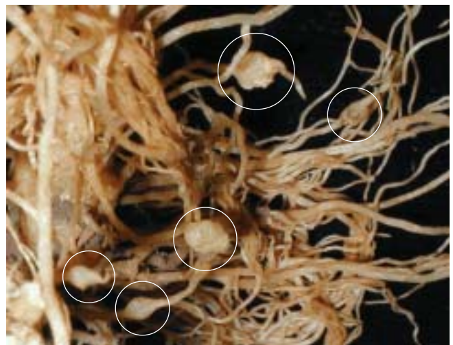
2. Dagiti Gall (napalawlawanda) gappuanan dagiti root-knot nematode kadagiti ramot dagiti kamatis.